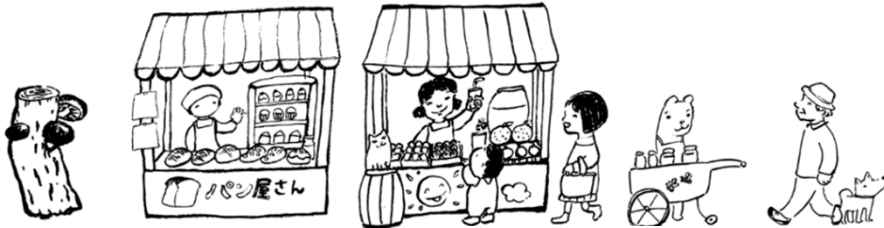
イラスト くらぬきしん