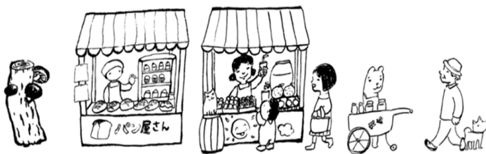
イラスト くらぬきしん